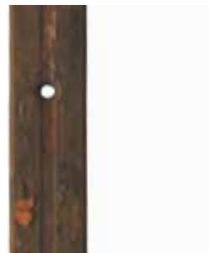
Rotaia non rivestita - dopo 4 ore di prova in nebbia salina